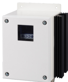
70304 im Wandaufbaugehäuse