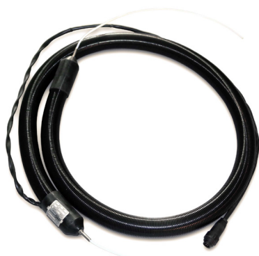
Typ 4M4/6 mit A und Y